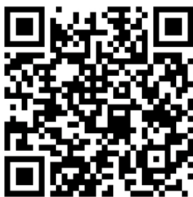
QR code APPLE

Scan hier de QR code om de Brel-home app te downloaden: